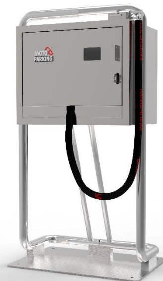
Mod. City: € 1.750,00*

*NB: i prezzi si intendono per l'acquisto di un singolo MotoParking; per l'acquisto a partire da 5 MotoParking (anche modelli misti) i prezzi sono: • Mod. Touring: € 2.150,00 • Mod. City: € 1.700,00