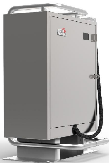
Mod. Touring: € 2.250,00*